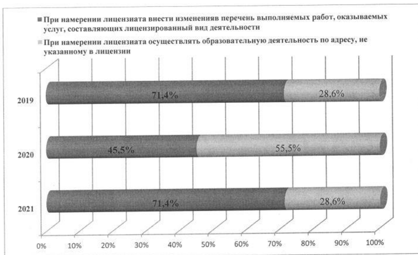
Диаграмма 2. Проведенные внеплановых выездных проверок по основаниям процедуры лицензирования, предусмотренных частями 7 и 9 статьи 18 Федерального закона «О лицензировании отдельных видов деятельности»

Результаты ни одной из проверок, проведенных Департаментом, не были признаны недействительными. Все проверки проведены без нарушения требований законодательства о порядке их применения. По результатам проверок к должностным лицам Департамента меры дисциплинарного и административного наказания не применялись.