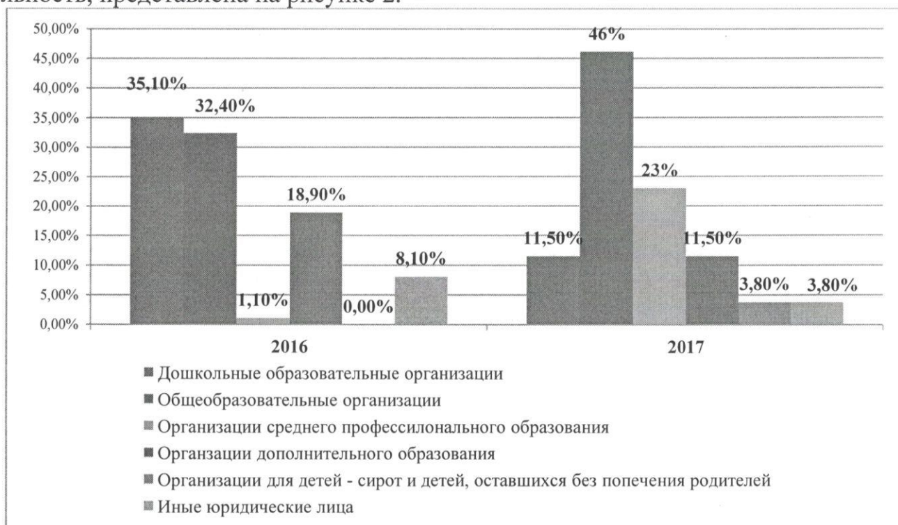
Рисунок 2. Сведения о поданных заявлениях о переоформлении лицензий в разрезе типов организаций, осуществляющих образовательную деятельность.

Сведения о поданных заявлениях в 2016 году и 2017 году о переоформлении лицензий в разрезе типов организаций, осуществляющих образовательную деятельность, представлена на рисунке 2.